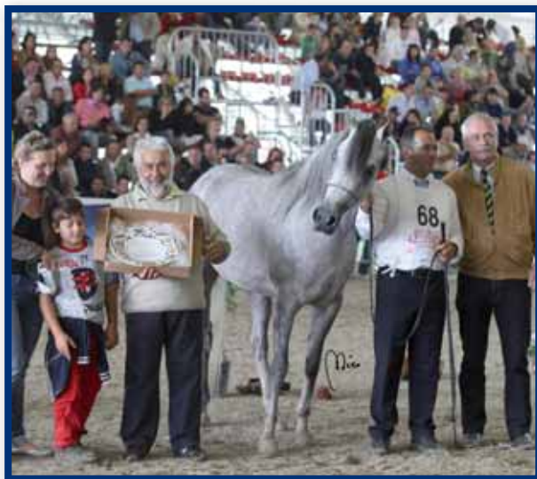
CF SHAMILA Champion Mares