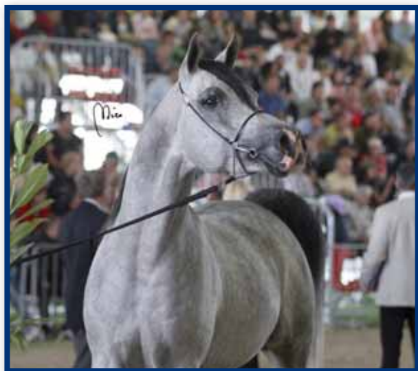
IM ICARE CATHARE Champion Stallions