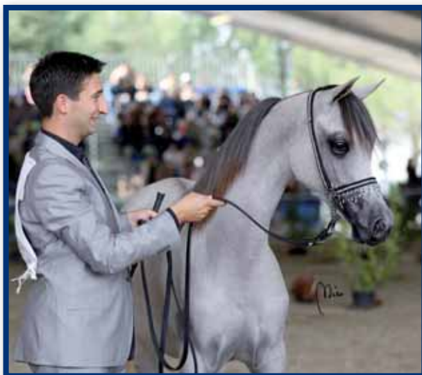
FT SHAELLA Champion Fillies