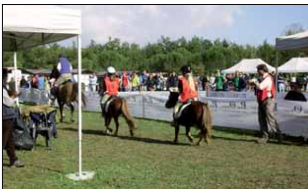
Partenza del Campionato Pony/The start line of the Ponies Championship