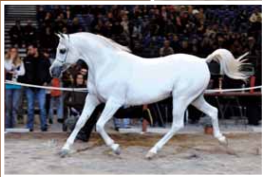
Silver L.A. KRONOS (WH JUSTICE x L.A. KALAHARI) CHION JEAN FRANÇOIS