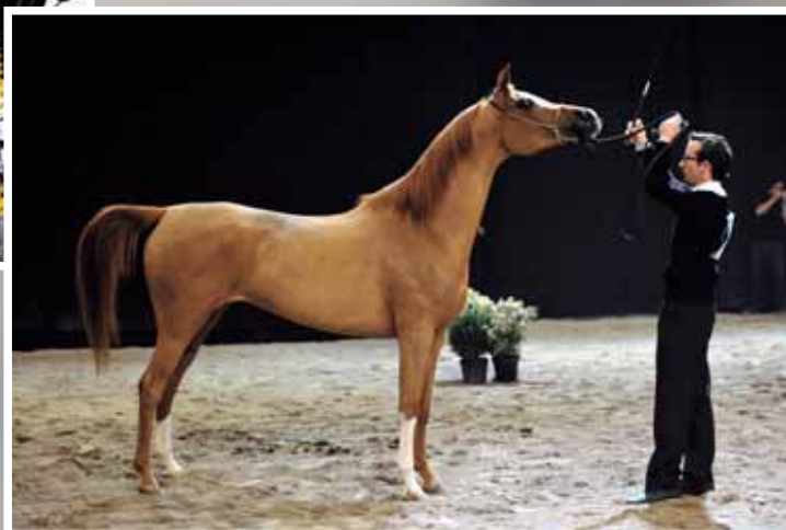
Bronze MAYSSA (BESSON CAROL x MESMERISE) LUGANS BEATA