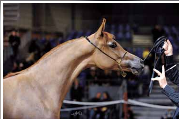
Bronze RUSCANA DE FONTANEL (MHERKIR DE NAUTIAC x PILOISKA) CLUCHIER SERGE