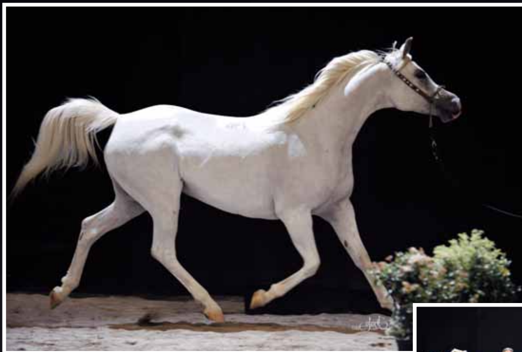
EUMENIDA (ELDON x EUZETIA) MORAND GILLES