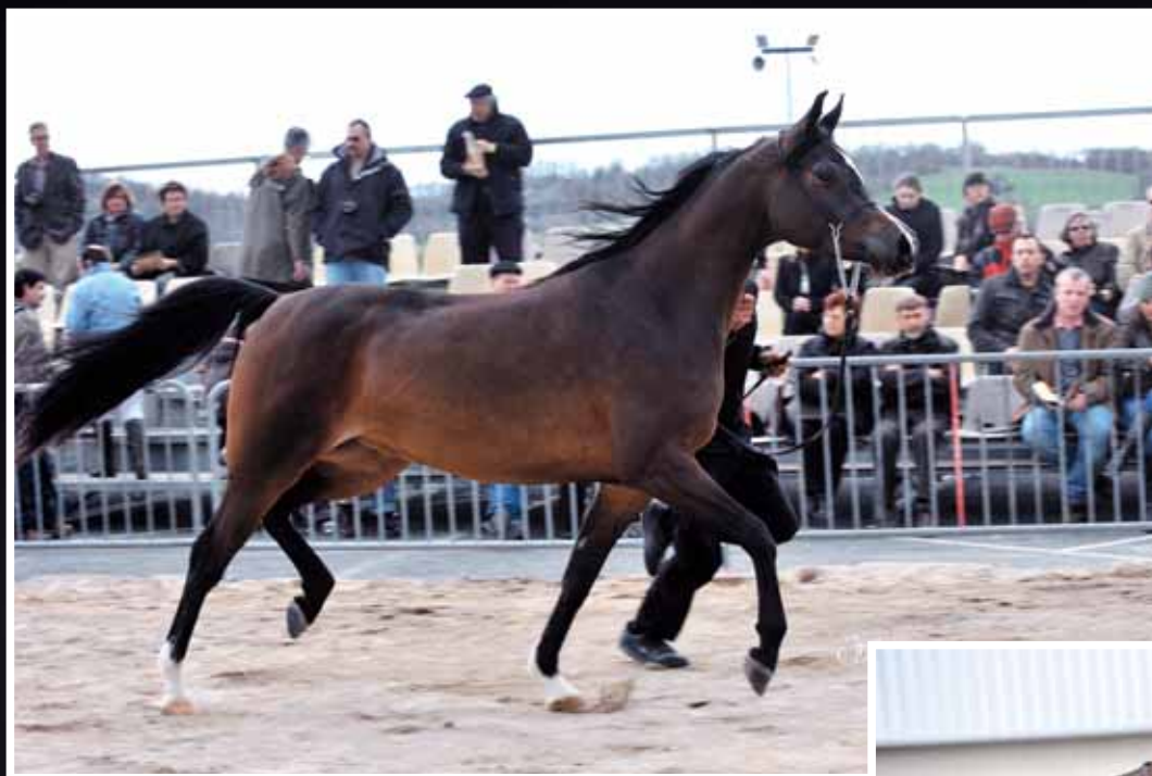
GADNES (PSYTADEL x GRACEA) JOSEPH ARABIANS