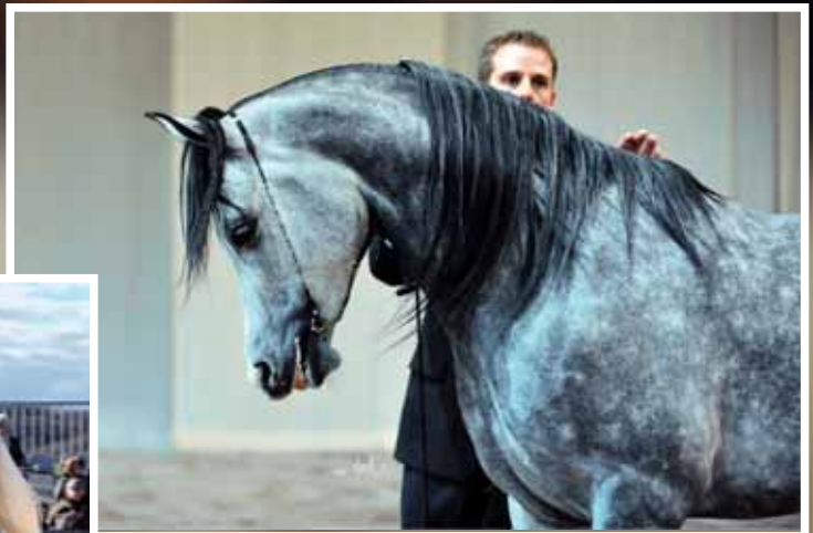
Bronze KILIMAGE (PADRONS IMAGE x COOL DOA) SUAD VRAZALIKA