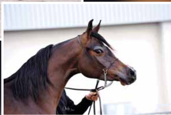
Silver HARMATTAN VIDJAYA (OR MARC x HAMY DE GARGASSAN) RÉGIS HUET