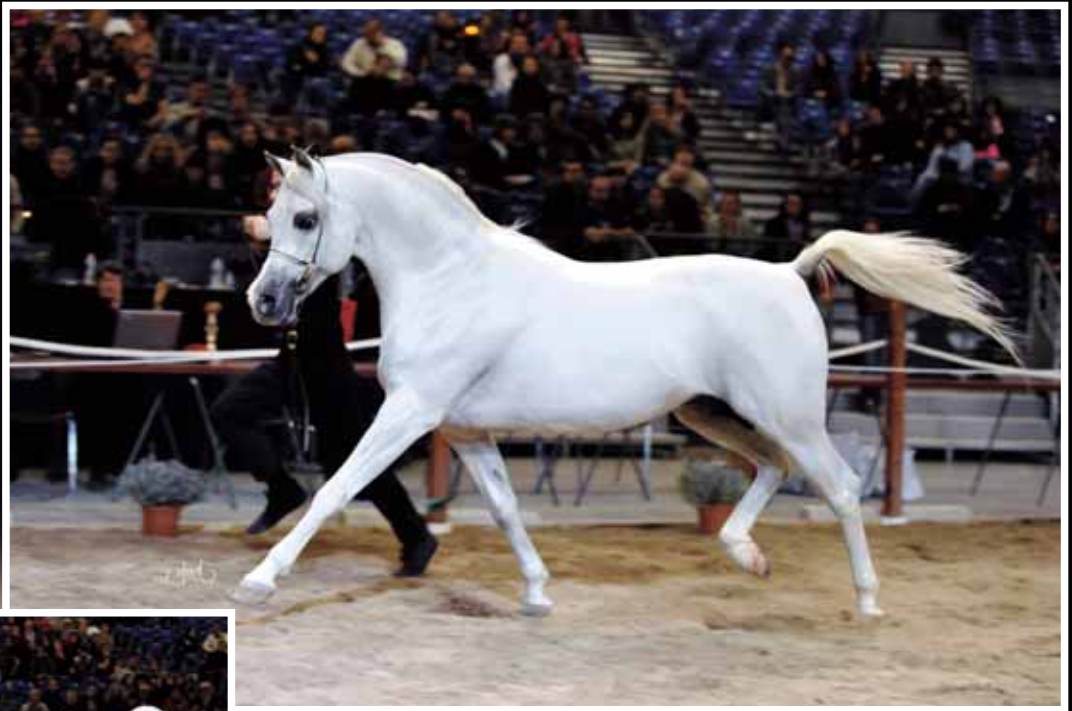
ESTA ESPLANAN (A.S. NATSIR APAL x ESKARTA) HARAS DE LA CHATAIGNIÈRE