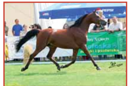
Milord Al Shaqab

1° Cl. Puledri di 2 anni - 1° Pl. Cots 2 years old