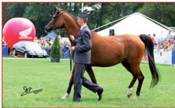
Samarcja Trofeo Waho/Waho Trophy

Stallion of Brazil and one of the best Arabian race horses in Polish history - Savannah (by Monarh AH) - the mare almost unbeaten on the racetrack, always placed in money, winning 13 out of her 18 races including Oaks, Criterium, International Europa as well as Sambor, Koheilan, Bialka, Ofir, Michalow, Kabaret and Figaro Stakes in Poland,