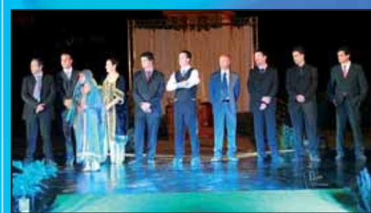
Gli Handler dell'Oriental Image 2007/The Handler of Oriental Image 2007