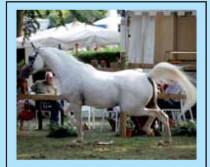
Al Rahed Ibn El Allah Abu