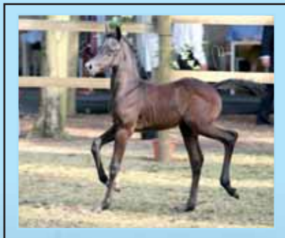
Serene Ibn Nejdi