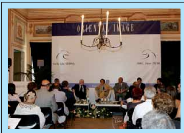
Economic Convention "Globalismo e intraprendenza. Interessi e culture in movimento" / Economic Convention "Globalism and entrepreneurship. Interests and cultures in motion"