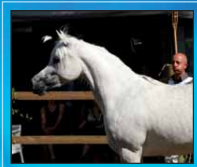
Aisha Bint Amaretto