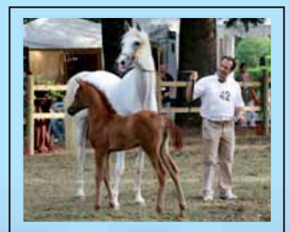
Yatima and her filly

Spettacolo offerto da Andalusa Horse durante la Serata di Gala di Fieracavalli One Show with one Andalusa Horse in Fieracavalli Gala Night