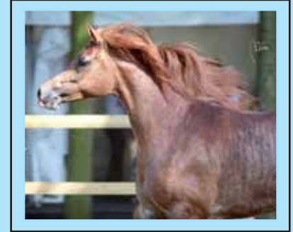
Rose of Kariim