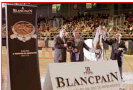
BLANCPAIN TROPHY KWESTURA

Accompanied by the ovation of the Parisian public, Marajj, Reserve Champion Colt