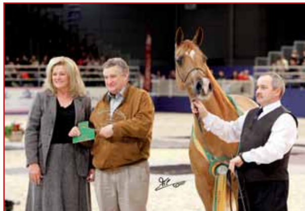
BEST MOVEMENT KWESTURA