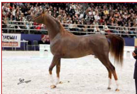
IM BAYARD CATHARE