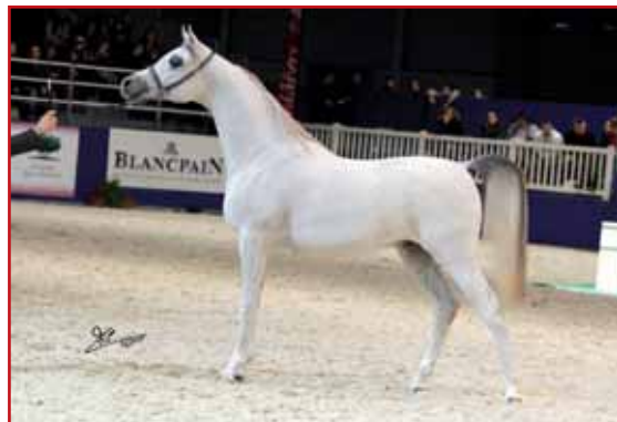
HYPNOTIC IBN ETERNITY