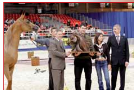
ACA AWARD HARMATTAN REYHANNA