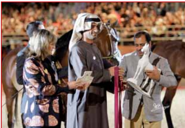
AL SHAQAB AWARDS