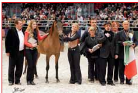
ACA ZAWAH DE LAM