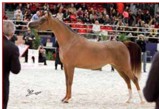
IM BYZANCE CATHARE