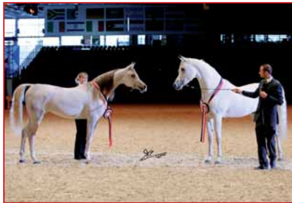
BEST EGYPTIANS FEMALE AND BEST EGYPTIAN MALE