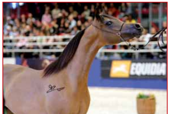
ZAWAH DE LAM