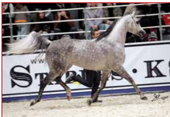
PERFECT DE LAFON