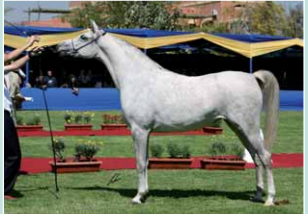
SHAHD AL GABRY 2° Cl. Puledre di 2 ann/2° Pl. Fillies 2005