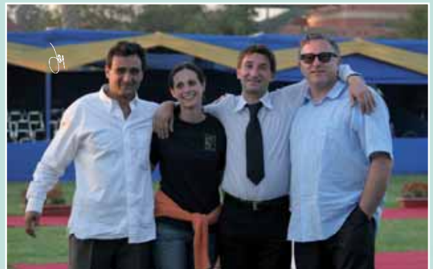
Il team di Cà di Gianni a Saqqara. Cà di Gianni Team in Saqqara Show.

The judging for the show was very close in a number of cases. In the first three female classes, there was a tie for second place. On the second day with the males, there were not only three classes with ties for second but also only one point difference between first and second place. As with every show in the world, there were two camps of opinion on the judging. Over all it was agreed that these judges were new to Egypt and brought the experience of their own history to the event. At the end of the day, spectators and breeders from Egypt and abroad were impressed with the quality and the enthusiasm of those who entered the show and are looking forward to future developments in all of the programs among both the newer and the established farms in Egypt.