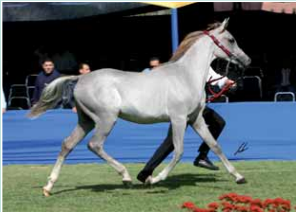
FAROUK AL SHARBATLY 1° Cl. Puledri di 1 anno/1° Pl. Colts 2006