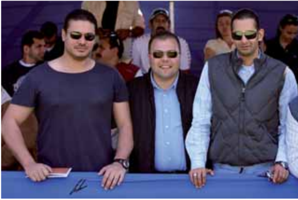
Da sinistra/left: Prince Saud, Tarek, Salem Bin Laden.

nato in Germania e attualmente parte del programma allevatorio di El Gabry ha conquistato anche il titolo di Riserva campione juniores. Montasir Al Hamd, un figlio di Ayser e Negma El Gabry si è classificato al secondo posto, confermando il suo momento di crescita agonistica.