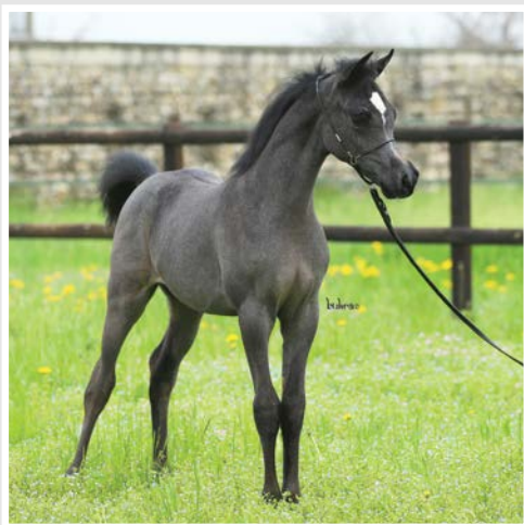
JUNAYD (Psyasic x Aisha) 1st Place Futurity male - International B-Show TravagliatoCavalli 2013