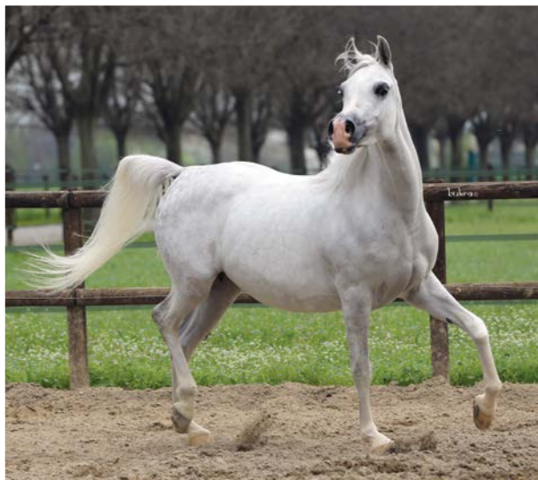
AISHA (Sdp Taylor x Matha Hary)