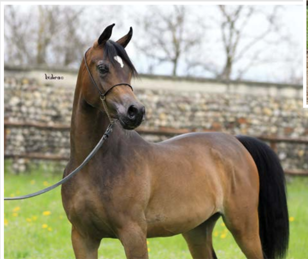
HADIYA AL MALI - 2011 (Royal Colours x M.M. Eileene) 1st Place Fillies, 1 years old Marina di Pietrasanta, International B 2012

Siamo prossimi a grandi eventi internazionali, come Menton, Chantilly, Vichy, il campionato Italiano a Salerno e a seguire il Campionato Europeo a Verona e qui mi fermo perchè mi sembra già molto. Sono certo di incontrati in quasi tutti questi show, ma a quali punti principalmente con i tuoi cavalli?